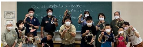
9/3 SDGs 杉の端材を使ったリース作り講座