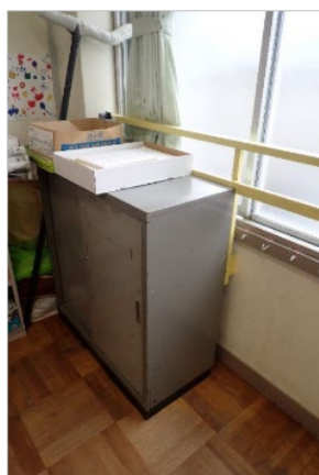
写真1 教室の窓際に設置された棚

消費者安全調査委員会は、被害の発生又は拡大の防止を図るため、小中学生が被災した事故等のうち、主に学校の施設又は設備が原因で発生したと考えられる事故等について、公立の小中学校を中心に調査を行うこととした（写真1、2は、訪問した学校において確認された、死亡の危険のある設備例）。