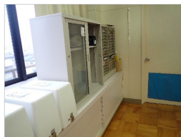
写真2 積み重ねられ固定されていない棚