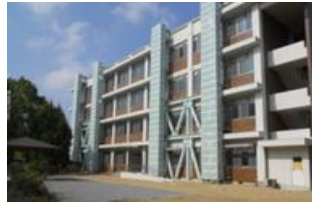
老朽改善された施設