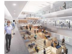
研究者間の連携を促進する最先端研究の拠点