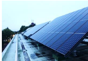
創エネルギー設備の整備