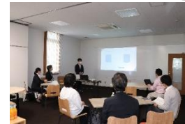
地域の教育研究拠点として人材育成、地域課題の解決