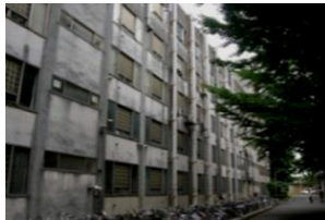
落下の危険がある外壁