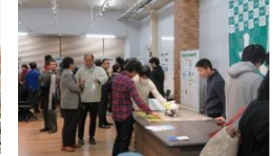
学生と起業家・地元企業との交流を促進する共創の場