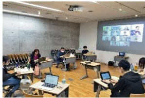
対面とオンラインを併用した教育環境