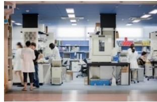
フレキシブルなオープンラボ