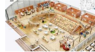
体育館をリノベーションしたコワーキングスペース、スタートアップ創出拠点