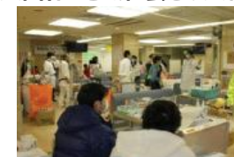
災害発生時の医療提供の継続・避難所としての活用