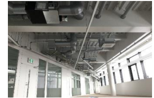
高効率空調の整備

老朽改善にあわせた機能強化等を行い、キャンパス全体が有機的に連携し、あらゆる分野・場面・プレーヤーが共創できる拠点となる「イノベーション・コモンズ」の実現を目指す