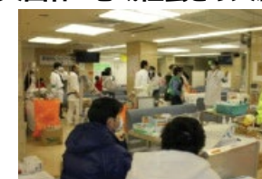
災害発生時の医療提供の継続・避難所としての活用