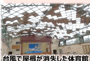
台風で屋根が消失した体育館