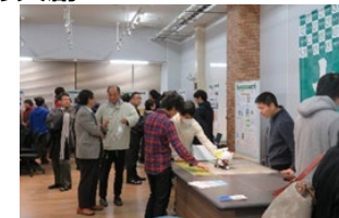
学生と起業家・地元企業との 交流を促進する共創の場