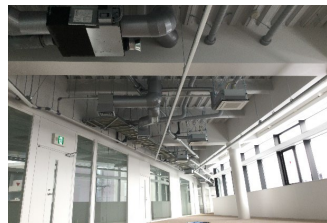
高効率空調の整備

老朽改善にあわせた機能強化等を行い、キャンパス全体が有機的に連携し、あらゆる分野・場面・プレーヤーが共創できる拠点となる「イノベーション・コモンズ」の実現を目指す