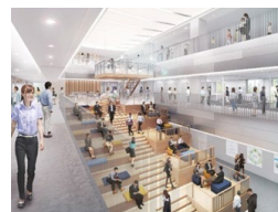
研究者間の連携を促進する最先端研究の拠点