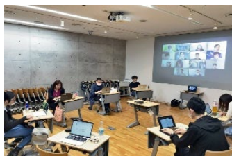
対面とオンラインを併用した教育環境