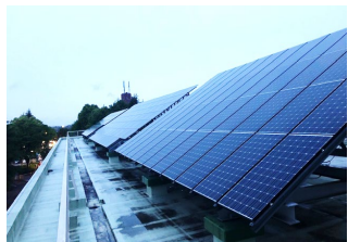
創エネルギー設備の整備