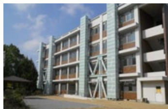
老朽改善された施設