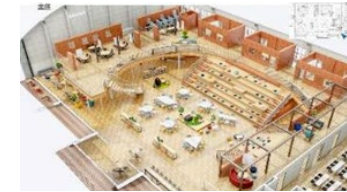
体育館をリノベーションした コワーキングスペース、 スタートアップ創出拠点