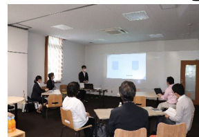
地域の教育研究拠点として 人材育成、地域課題の解決