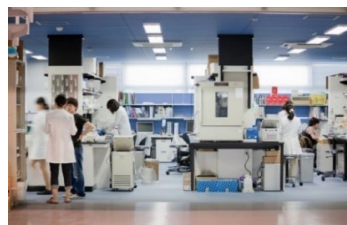
フレキシブルなオープンラボ