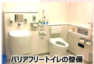
バリアフリートイレの整備