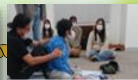
南九州大学野村研究室