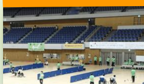
宮崎県ボッチャ協会