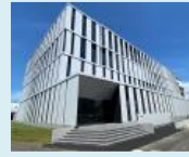
量子機能創製研究センター棟 (イメージ図)