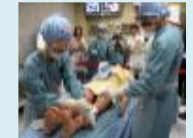
高度専門人材育成