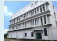
高度被ばく医療線量評価棟