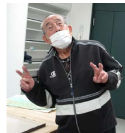
自分の作品が きれいに額装できました

どうして作品を額縁に入れるのか、その必要性や作品の見え方が変わることについて学び、実際に額縁を使って見栄えの違いを確認しました。