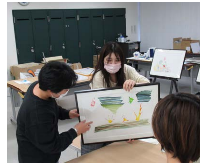
作品の位置がずれていないか、せっかく描いたところがマットで隠れていないか、みんな確認して完成