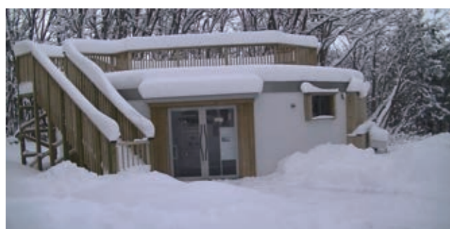
北海道教育大学岩見沢校「森の岩ギャラリー」

展示会名：いわみざわアートアカデミー「Our Life is Our Art」 会 期：2021年12月18日(土)～12月24日(金) 会 場：北海道教育大学岩見沢校「森の岩ギャラリー」 来場者数：107名 出展者数：44名