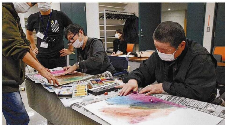
さまざまな画材や画法で絵画作品に取り組むアートアカデミーの参加者ら

【岩見沢】市内外の障害者が絵画などの芸術を学ぶことができる「いわみざわアートアカデミー」が、市生涯学習センターいわなびで始まった。初回の10日は