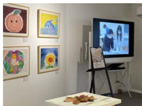
大型モニターでアートアカデミーでの創作の様子等を配信