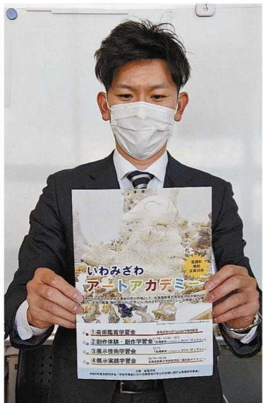
障害者が芸術について学ぶアートアカデミーのチラシ