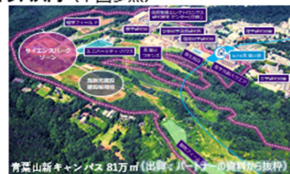
次世代放射光施設 (イメージ図)