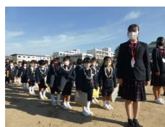
佐用合同防災訓練