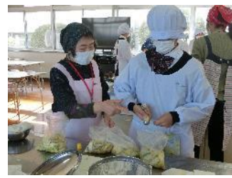
防災バッククッキング講習会