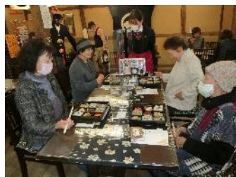
「高校生カフェ」 in.瓜生原