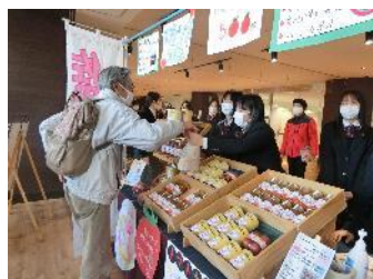
開発商品の広報即売会