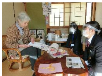
高校生訪問サービス