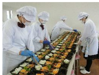
給食サービスボランティア