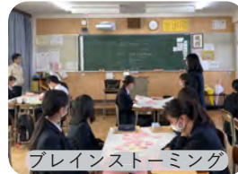
ブレインストーミング