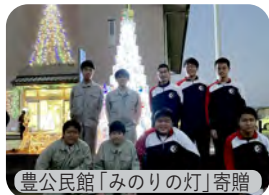
豊公民館「みのりの灯」寄贈