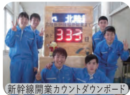
新幹線開業カウントダウンボード