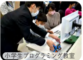
小学生プログラミング教室