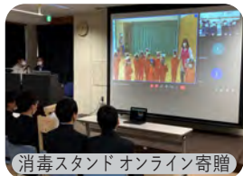
消毒スタンドオンライン寄贈