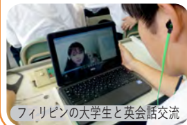
フィリピンの大学生と英会話交流