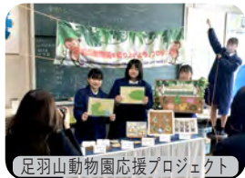
足羽山動物園応援プロジェクト