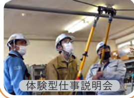
体験型仕事説明会