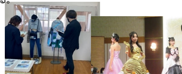
リメイクコンテスト (審査の様子)