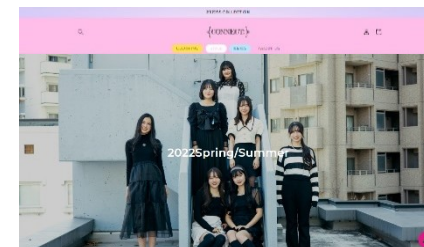
本校のブランドCONNECT:ECサイト トップページ