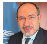
開会挨拶 Tawfik Jelassi (ユネスコ事務局長補)