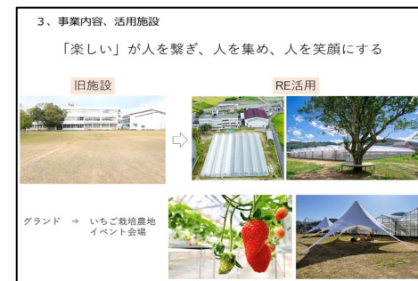
事例発表③ イチゴ農園施設として活用 (京都府福知山市×井上株式会社)

クラウドファンディングなど多様な資金調達を図りながら、地元産業との協業など地域の力を生かし、未来の地域の価値づくりと想いをつなげるウイスキー造りに取り組もうとしていることが報告された。