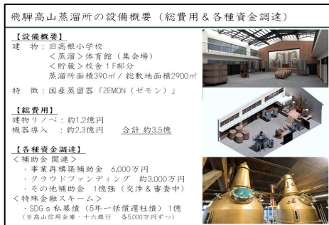
事例発表② ウイスキー蒸留所として活用 (岐阜県高山市×有限会社船坂酒店)

ITに関する無料相談や講座等を行うとともに、地域交流のスペースの開放やイベントの企画運営を行うなど、ITを通じて地域を元気にする取組を全国的に展開していることが報告された。