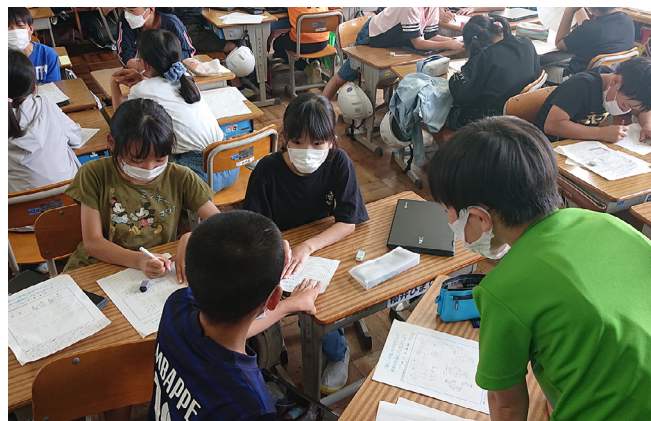
【写真2 新しい学校デザイン出前授業の様子】

教育内容の充実については、「9年間で子どもを育てる」意識や体制づくり、地域と共に子どもを育てる体制づくりをさらに進めるため、先進事例の研究や研修などを実施する中で、牧之原市に合った教育活動の確立を図っていきます。