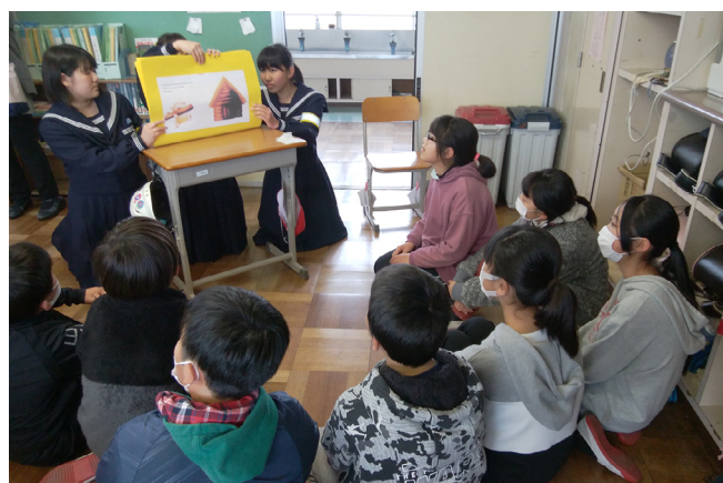
【写真4 中学生が作った英語の紙芝居を小学生に読み聞かせ（小中連携事業）】

一つ目は、子どもたちの個性や能力を一層伸ばすために、発達段階に応じて身に付ける力と9年間の系統立てた指導方法を明確にする取組です。各教科の9年間のカリキュラムや授業の受け方、家庭の学びの仕方などの学びをつなぐ「学習指導のスタンダード」と、小中学校で目指す児童生徒像や生活のきまりを相互に理解し、9年間の指導体制を構築するための育ちをつなぐ「生活指導のスタンダード」を作成するものです。現在、市教育会の組織を基盤に、教員がチームで検討しており、令和6年度までにすべての教科でカリキュラムをつくる予定です。このカリキュラムが新しい義務教育学校の教育課程の原案となるよう、試行、研究、検証、改善のサイクルにより、より良いものになるよう進めていきます。