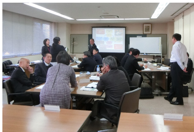
【写真6 教頭先生を対象にしたコミュニティ・スクール研修会の様子】

モデル校では、地域の方が校内に入ることや教育課程を承認することへの学校の抵抗感を軽減するため、まず、学校と地域をつなぐコーディネーター役となるCSディレクターを置きました。さらに、「CSルーム」をつくり、学校に来たボランティアが気軽に立ち寄り、地域の方同士や教職員と交流や情報交換をしたり、作業をしたりできるようにしました。