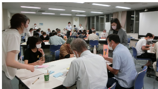
【写真1 地域ワークショップの様子】

学校区は、再編計画の核となる部分であると同時に、市民にとっては、一番思い入れが強い部分でもあります。そのため、策定委員会では、全小学校区において、自治会、小中学校の保護者、幼稚園・保育園・こども園の保護者などを対象にワークショップを開催しました。そこで、参加者