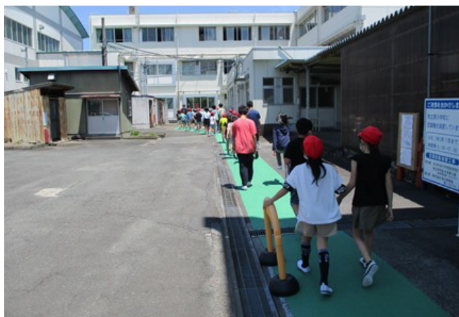
【写真5 隣り合う小中学校間を上靴で移動できるグリーンロードを整備（小中連携事業）】

また、開校の4年ほど前からは、開校に向けた準備会を立ち上げ、各種すり合わせや思いの共有などの機会を設けるなど、新しい学校に希望を持ち、つくる楽しさを感じ、主体的に学校づくりに関わる意識の醸成や体制の構築をしていきます。