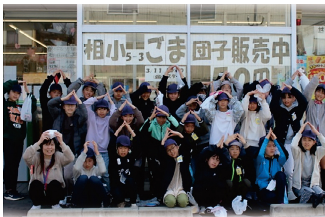
【写真3 考案した作品を地元の菓子店とコンビニの協力を得て実際に販売しました】

令和2年度からは、「地域」をテーマとしたプログラムの試行事業として、静岡大学との協働による「アースランチプロジェクト」を、小学生を対象に実施しています。これは、地元食材を活用したメニューを考案し、調理し、プレゼンテーションする取組です。創作するプロセスを通して、学校や地域の特色、自分の体と食物の関係について理解し（知識・技能）、身近な資源を再発見・活用し、試行錯誤を繰り返しながら改善していく（思考・判断力・表現力）とともに、