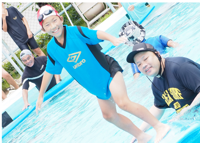
【写真8 地域の方による学校プールでのサーフィン教室】

モデル校が活動の楽しさと効果を伝えてくれたおかげで、予定より1年早い令和3年度に、全校にコミュニティ・スクールを設置することができました。