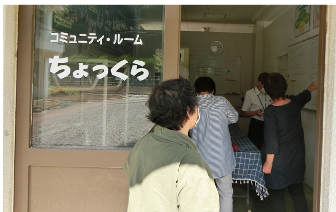
【写真7 学校の一角に整備したCSルーム】

また、地域の方が外部講師として授業をしたり、畑で子どもたちと一緒に作物を作ったりとさまざまな活動が行われました。これまでは、その活動の場に来て手伝うだけでしたが、コミュニティ・スクールができたことにより、自分たちの活動と教育活動のつながりが見え、地域の方はよりやりがいを感じ、楽しく活動ができるようになりました。教職員は、自分たちだけではできない活動ができたり、地域の方からのさまざまなサポートを受けたりすることで、コミュニティ・スクールのよさを実感してくれています。