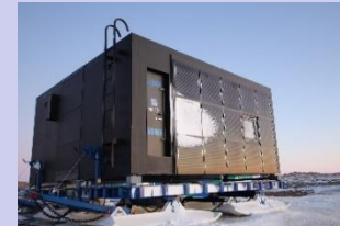
内陸観測拠点の居住空間となる予定の南極移動基地ユニット