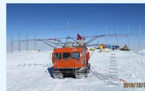
氷床レーダー探査