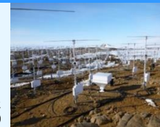
昭和基地に設置された大型大気レーダー(PANSY)

南極だからこそ得られる観測データから、全球の気候変動や氷床変動の過去と現在の現象を読み解くことにより、将来の地球環境システム(例えば海水準変動)の確実な予測につなげる