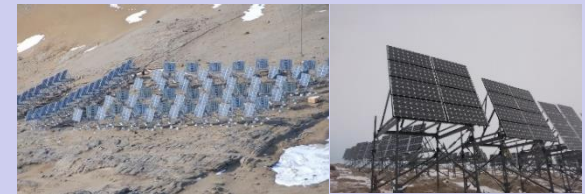
昭和基地に設置されている太陽光パネル群