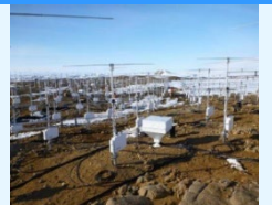
昭和基地に設置された大型大気レーダー(PANSY)

南極だからこそ得られる観測データから、全球の気候変動や氷床変動の過去と現在の現象を読み解くことにより、将来の地球環境システム(例えば海水準変動)の確実な予測につなげる