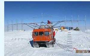
氷床レーダー探査