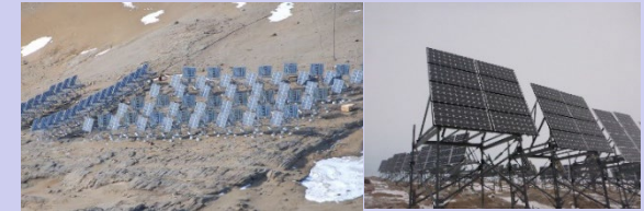
昭和基地に設置されている太陽光パネル群