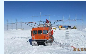
氷床レーダー探査