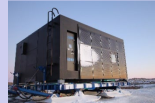
内陸観測拠点の居住空間となる予定の南極移動基地ユニット