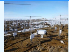
昭和基地に設置された大型大気レーダー(PANSY)

南極だからこそ得られる観測データから、全球の気候変動や氷床変動の過去と現在の現象を読み解くことにより、将来の地球環境システム(例えば海水準変動)の確実な予測につなげる