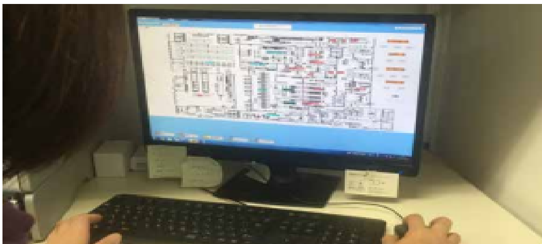
画13 調理室の温度・湿度を時間ごとにパソコンに記録し事務所で管理