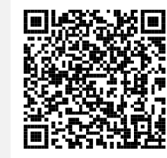
“Tungkol sa elementaryang paaralan sa Japan”