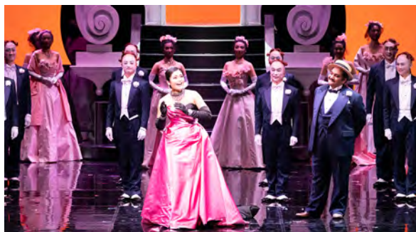
文化庁芸術祭オープニング オペラ「チェネレントラ」

さらに、次代の文化芸術を担う新進芸術家等に対し高度な技術・知識を習得させるための事業や文化の作り手と受け手をつなぐ役割を担うアートマネジメント人材を育成する事業のほか、若手芸術家が海外での実践的な研修に従事する機会を提供する等の人材育成に取り組んでいます。