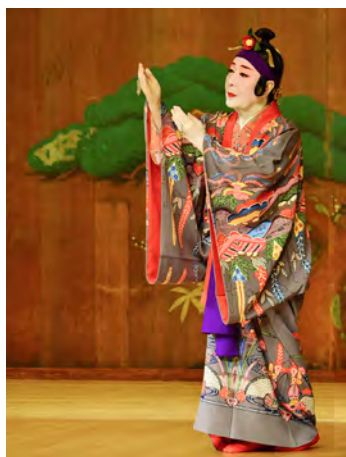
重要無形文化財「琉球舞踊立方」保持者：志田房子 (令和3年10月28日認定)