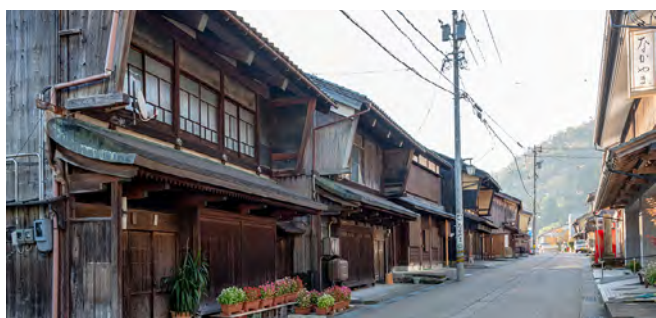
南越前町今庄宿重要伝統的建造物群保存地区 (令和3年8月2日選定)