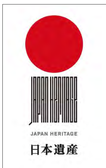
「日本遺産 (Japan Heritage)」ロゴマーク

令和4年4月現在、全国で104のストーリーを日本遺産に認定しており、日本遺産を通じた地域活性化・観光振興に資する情報発信や人材育成、普及啓発、活用整備に係る事業等に対して支援を行っています。