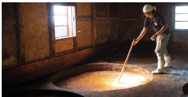
登録無形民俗文化財「讃岐の醤油醸造技術」木桶を用いた仕込みの様子 (香川県小豆島町) (令和3年9月30日登録)