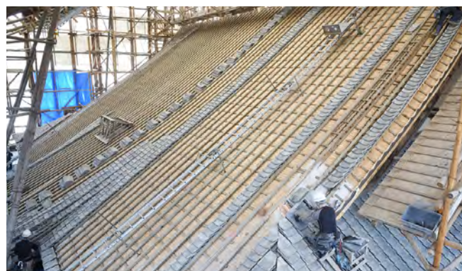
本隆寺本堂 本瓦葺施工（北面）

東日本大震災や平成 28 年熊本地震等の大規模災害への対応として、被害を受けた国指定等文化財について、早期の保存・修復を図るため、文化財の所有者等が実施する被災文化財の復旧事業に対する指導、経費の補助など、必要な措置を講じます。