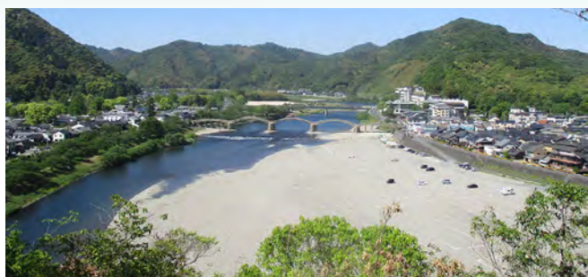
錦川下流域における錦帯橋と岩国城下町の文化的景観 (令和3年10月11日選定)