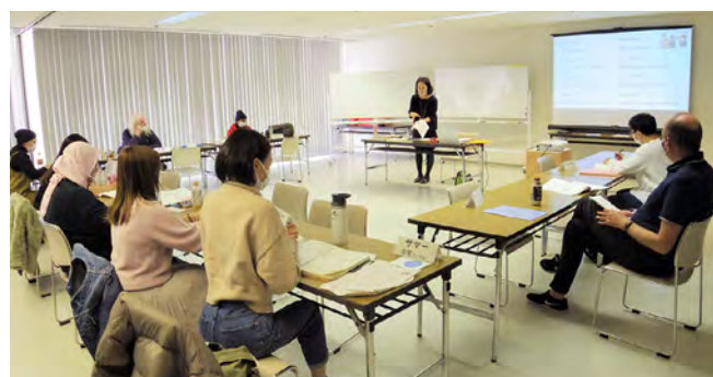
文化庁事業による地域の日本語教室の例

日本で生活する外国人の日本語教育環境を整備するため、地域の実情に応じた日本語教育の実施等を支援する「生活者としての外国人」のための日本語教育事業を実施するとともに、地域日本語教育の総合的な体制づくり推進事業を実施し、都道府県や政令指定都市が関係機関等と有機的に連携し、日本語教育環境を強化するための総合的な体制づくりを支援しています。