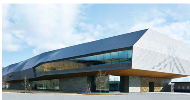
国立アイヌ民族博物館