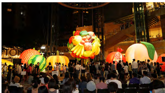
六本木アートナイト