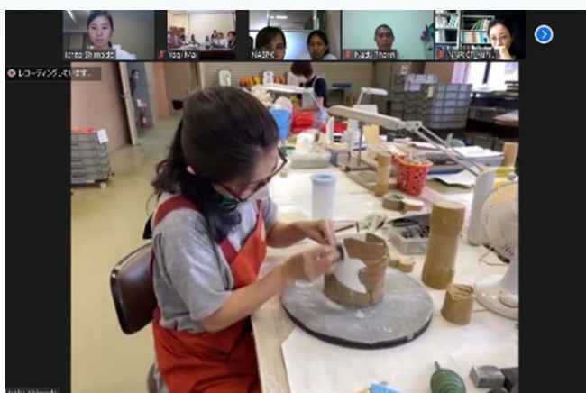
写真②：カンボジア、サンボー・プレイ・クック遺跡群の保存・修理のための人材育成事業