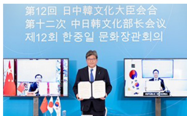
写真①：第12回日中韓文化大臣会合（2021）

また、我が国の技術や知見を生かした文化遺産国際協力を推進し、人類共通の財産である世界各地の文化遺産の保護に貢献します。