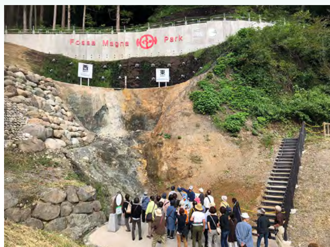
糸魚川市根知の糸魚川-静岡構造線 (令和3年3月26日指定)