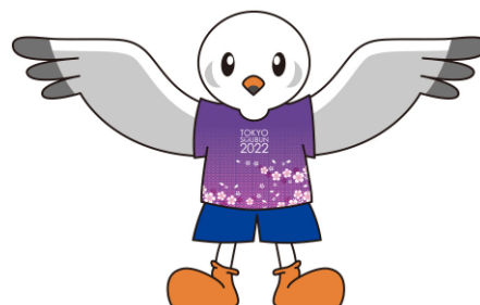
とうきょう総文2022大会マスコットキャラクター ゆりーと

伝統文化の継承・発展に取り組む高校生が日頃の成果を披露し、交流する場となる全国高校生伝統文化フェスティバルを京都で開催しています。