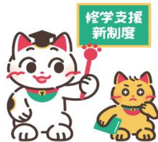
「高等教育の修学支援」公式キャラクター 【まねこ先生（左）とまなびーニャ（右）】

より多くの学生・生徒やその保護者の方々に、本制度のことを知っていただけるよう、 文部科学省と日本学生支援機構において次のコンテンツを用意しています。是非ともご覧いただくようご案内ください。