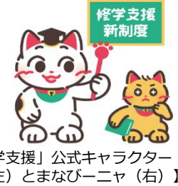
「高等教育の修学支援」公式キャラクター 【まねこ先生(左)とまなびーニャ(右)】