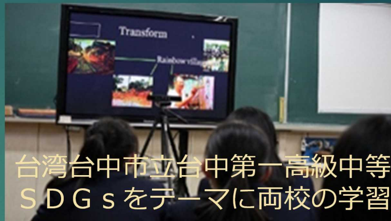
台湾台中市立台中第一高級中等学校と SDGsをテーマに両校の学習成果を報告