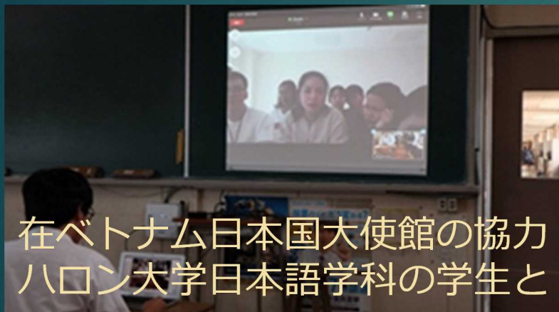
在ベトナム日本国大使館の協力 ハロン大学日本語学科の学生と