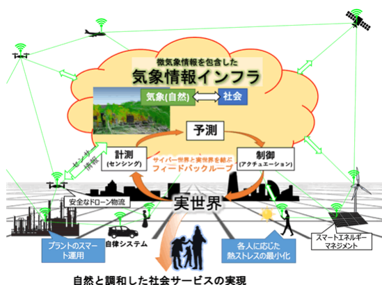
図1：自然と調和した自律制御社会

このような未来社会を実現するうえで、人間生活に直結する微気象が非常に重要となる。しかし、社会が抱える様々な課題に関係しているにもかかわらず、微気象は学術的にはほとんど手が付けられていない。本研究領域は、その予測を世界に先駆けて実現し、予測情報に立脚した新たな社会サービスの実現可能性を示すことで、自然科学と社会に新たな変革をもたらす。単なる現象の理解と予測では、最終的に新しい社会的価値を生み出すことはできない。各々の社会的課題の解決に有効となる社会基盤の構築が不可欠であり、そこで重要となるのは、各々の課題解決に必要な「時空間スケールと精度」を的確に捉えた観測・予測・制御の連携技術である。本研究領域では、まずは観測と予測の融合に焦点を当てて新学術創成の端緒を開く。単に最先端の観測と予測を連携するのではなく、最終目的に応じた適切な「時空間スケールと精度」を共有しながら、価値を生み出す真の融合を実現する。