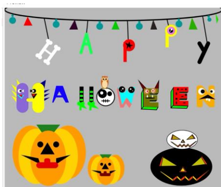
作成したプロトタイプ

fill(200,0,0); //赤色 ellipse(200,220,250,300); //てんとう虫の赤い部分 strokeWeight(2); //小さい丸の輪郭の太さ fill(0); //黒 ellipse(140,300,50,50); //左下の丸 ellipse(200,120,70,70); //真ん中の丸 ellipse(300,300,50,50); //右下の丸 ellipse(120,170,50,50); //左上の丸 ellipse(160,230,50,50); //左真ん中の丸 ellipse(280,170,50,50); //右上の丸 ellipse(240,230,50,50); //右真ん中の丸 fill(0); //黒 strokeWeight(3); //真ん中のラインの太さ line(200,70,200,370); //真ん中のライン strokeWeight(3); //輪郭の太さ