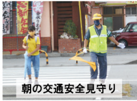
朝の交通安全見守り