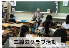
三線のクラブ活動