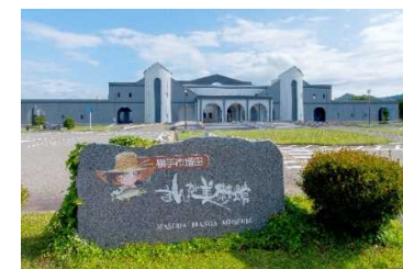
増田まんが美術館