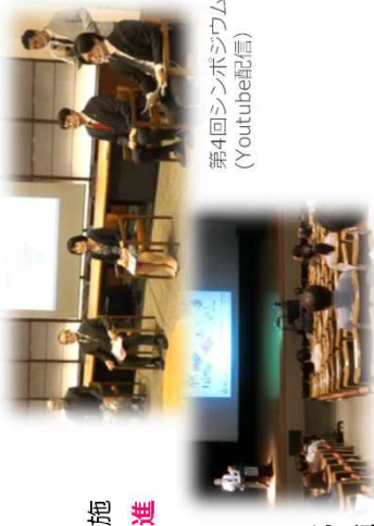
第4回シンポジウム (Youtube配信)