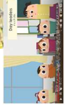
日本型教育に関する動画配信（8言語）など