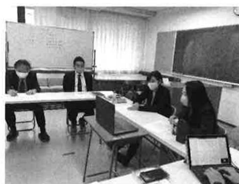
<写真 5：SVR と事例提供者>