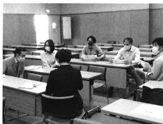
<写真 9：ディスカッション 2>