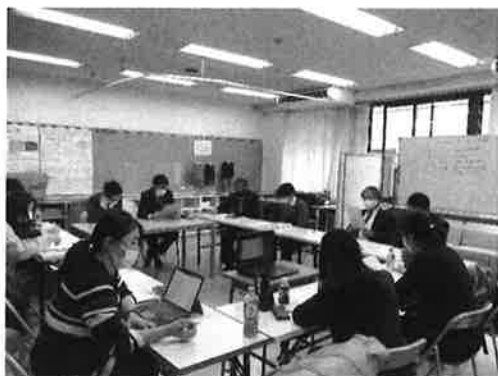
<写真 4：対面でのケース会議>