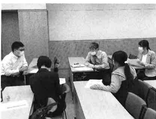
<写真 8：ディスカッション 1>