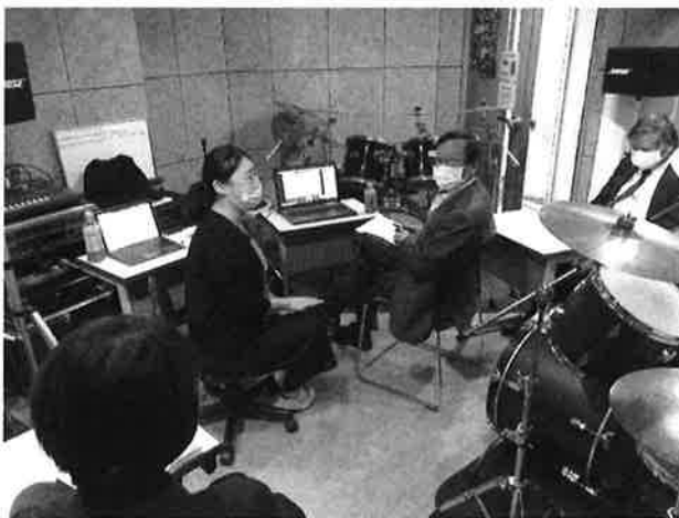
<写真2：スーパーバイザーと参加者 Teams を使って>