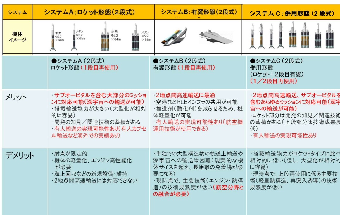
表2 将来宇宙輸送システム飛行形態例の特徴比較