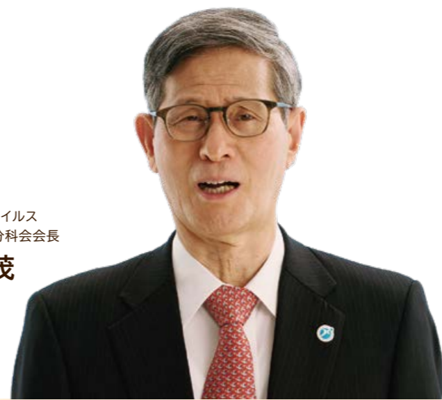
新型コロナウイルス 感染症対策分科会会長 尾身 茂