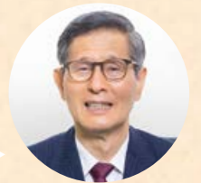
新型コロナウイルス 感染症対策分科会会長

差別や偏見、嫌がらせが広がると医療従事者やエッセンシャルワーカーの離職が増える可能性があります。また、感染者への同様のことが増えると検査を避けたり、感染を隠そうとする人が増え、感染拡大を抑えにくくなります。