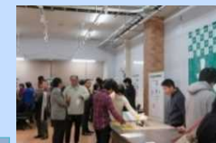
地元企業との交流会