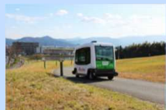
構内道路を活用した 実証実験