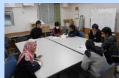
国際寮における 日常的な国際交流