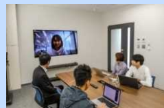
ICTによる コミュニケーション