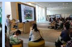
地域への公開講座