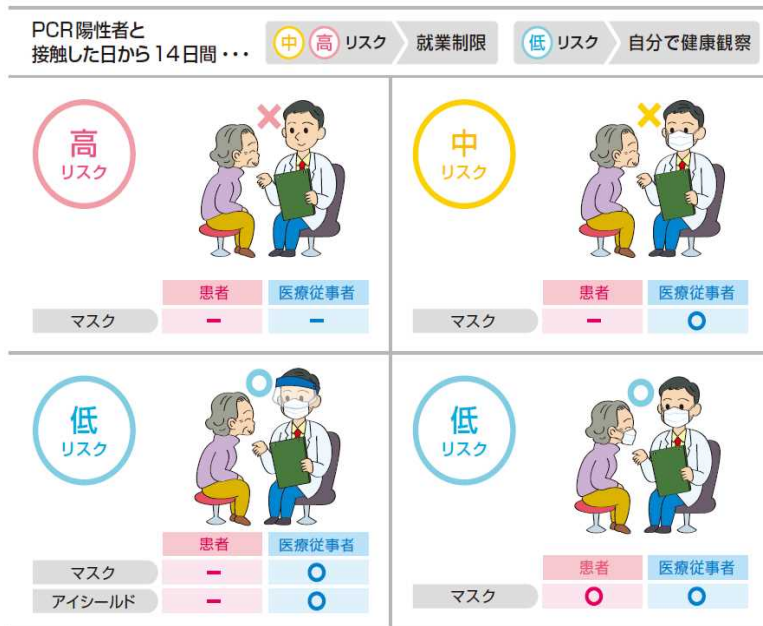
図 医療従事者の暴露のリスク評価と対応

日本環境感染学会. 医療機関における新型コロナウイルス感染症への対応ガイド. 第3版, 2020を参考に作成