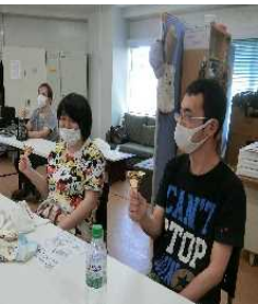
音楽クラブでハンドベル (スポーツ、アート部も)