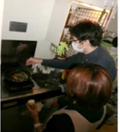
ヘルパーさんと ホットケーキ作り