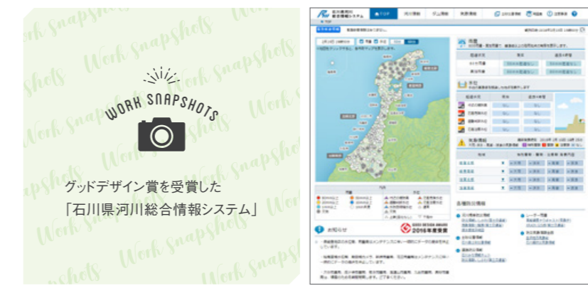
グッドデザイン賞を受賞した「石川県河川総合情報システム」