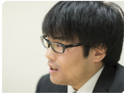
HE CONTINUES CHASING A DREAM.

システムエンジニアという職に就くことを決めたのは就職活動のとき。先生から推薦していただいたのが、学校に募集がきていた大手企業のシステムエンジニアだったのです。先生から詳しく話を聞き、これまで学んだプログラミングの知識を生かしつつ、自分が思い描いていた仕事よりも、さらに大きな仕事に携われる可能性を感じ、システムエンジニアの道を決断しました。