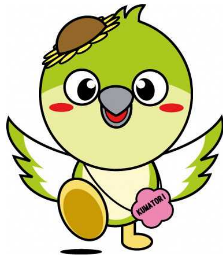
熊取町マスコットキャラクター 「メジーナちゃん」