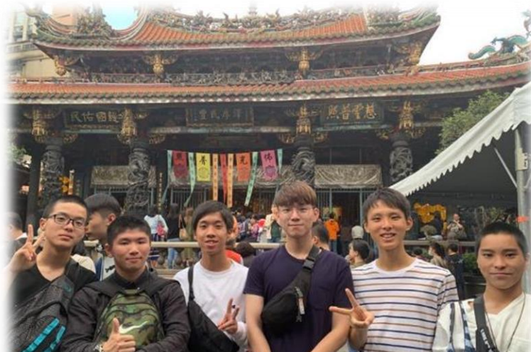
台湾旅行プロデュース大会優勝