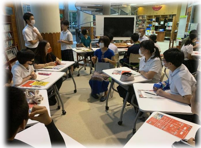
トビタテ留学ジャパン せかい部