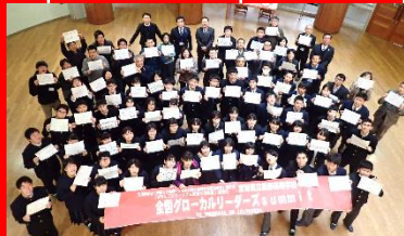
全国グローバルリーダーズsummit (飯野高生による企画・実践)

視察受入 茨城県、神奈川県、栃木県、富山県、新潟県、東京都、三重県、和歌山県、大阪府、兵庫県、徳島県、岡山県、島根県、広島県、福岡県、長崎県、熊本県、鹿児島県の高校等