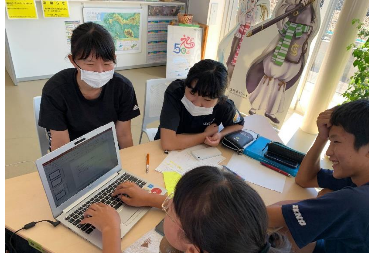
県外生のミニ探究