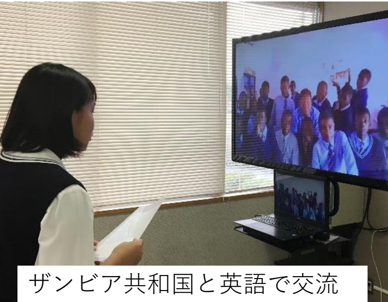
ザンビア共和国と英語で交流