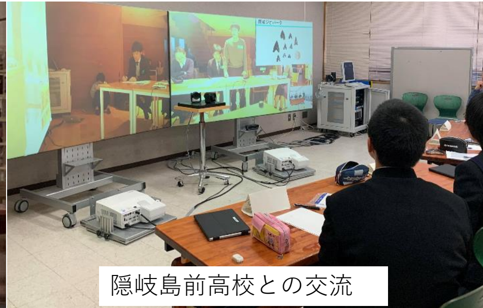
隠岐島前高校との交流