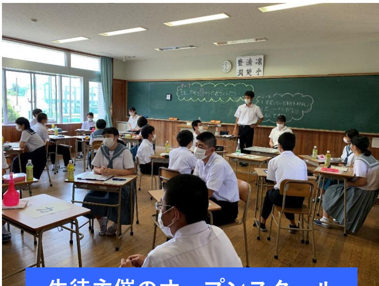
生徒主催のオープンスクール