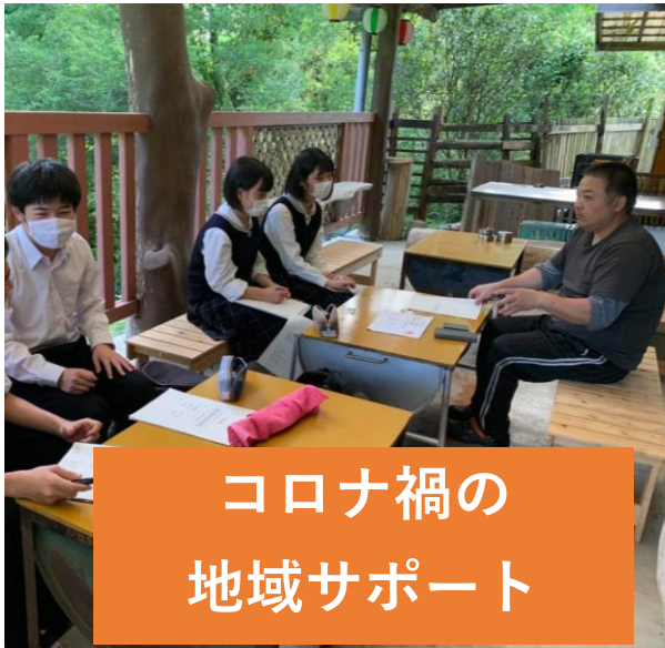
コロナ禍の 地域サポート