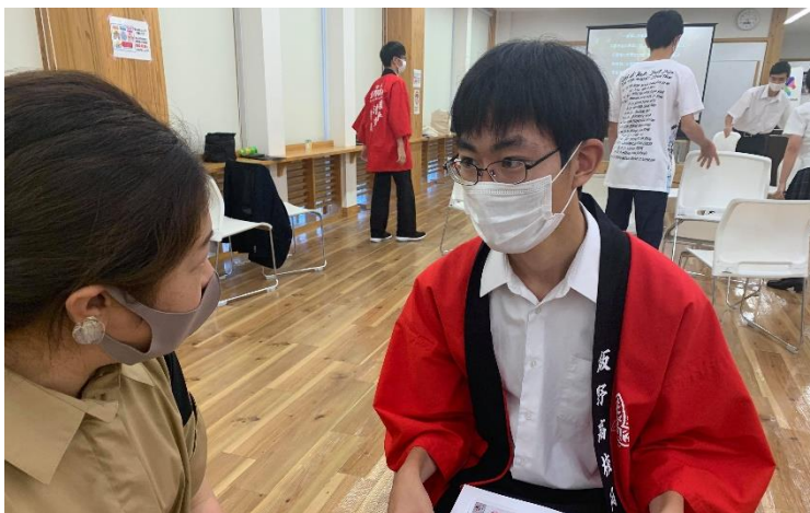
観光列車プロジェクト