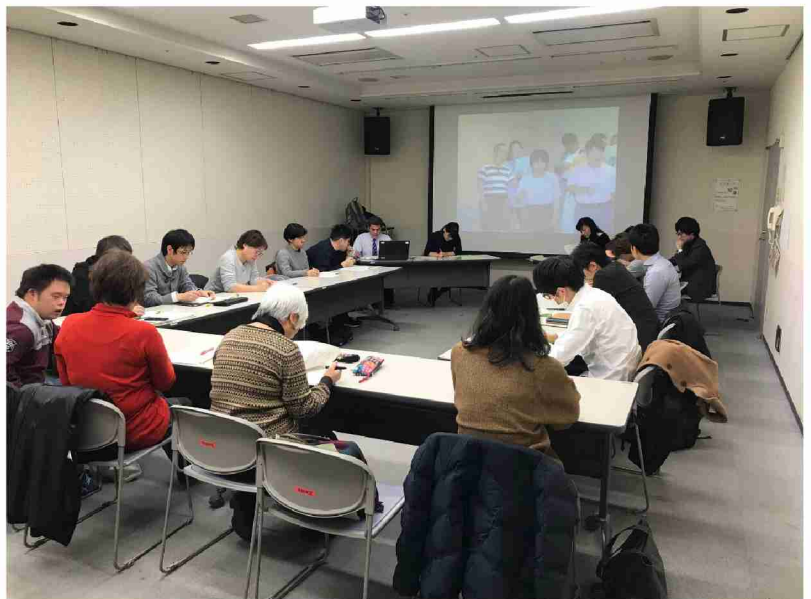
午後 分科会の様子