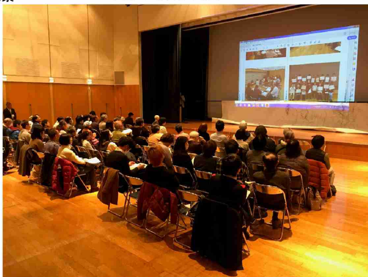
午前 全体会の様子