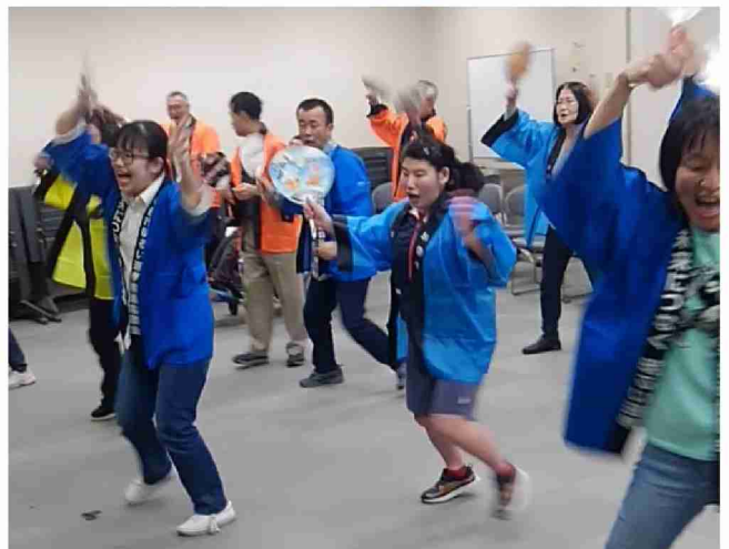
第1部(劇)の練習風景