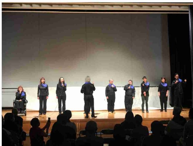
風になる会 発表風景