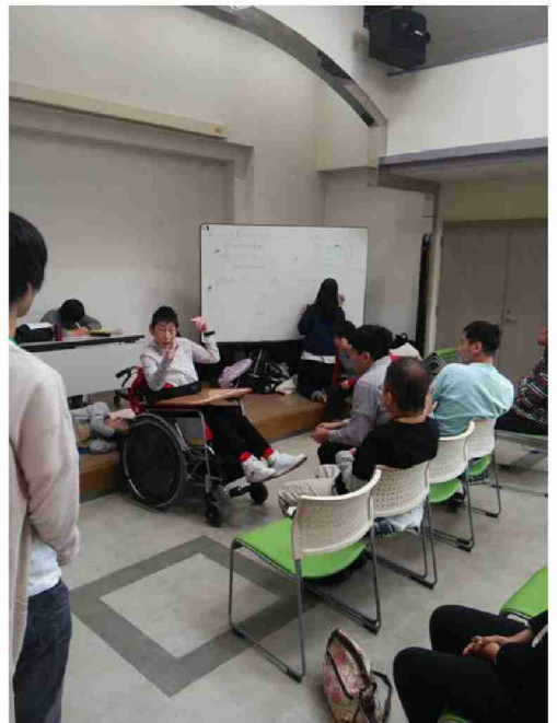
実行委員会で話し合う風景