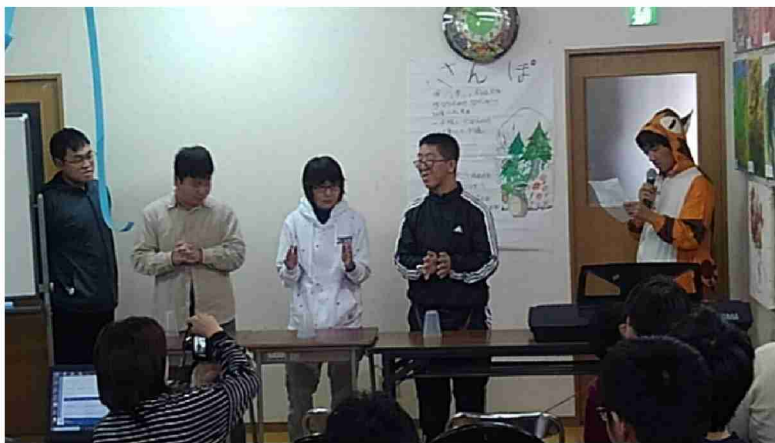
コップを使ったパフォーマンスでの交流風景