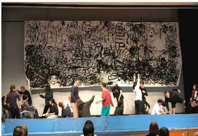
自分だけの踊りを探す旅の発表風景