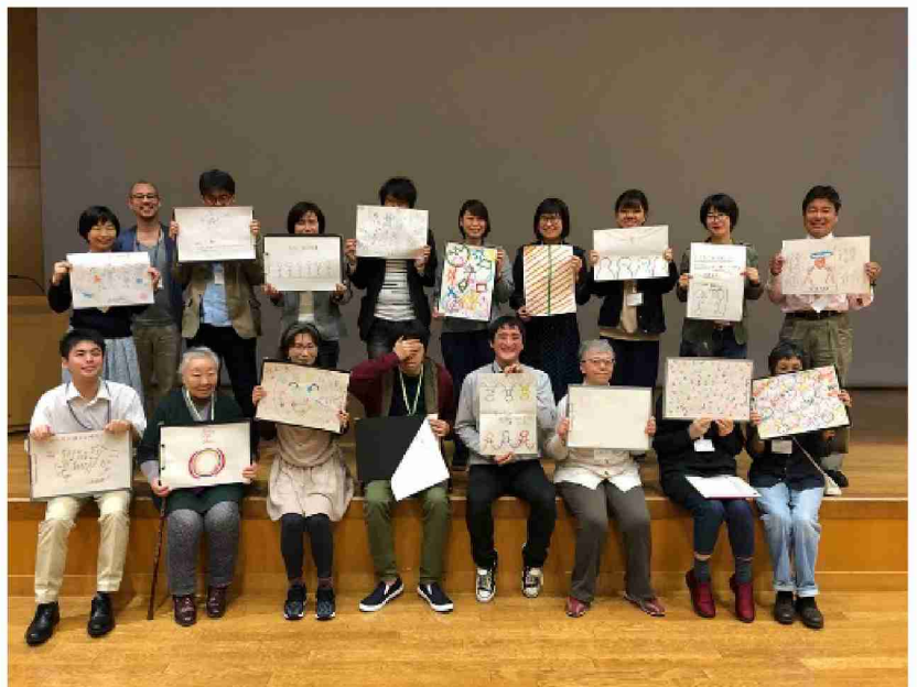
それぞれが目指す青年学級の姿をイラストにしました