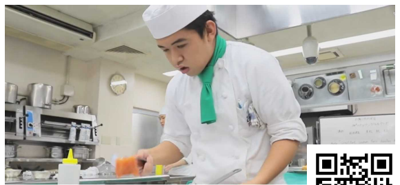
育成調理師専門学校