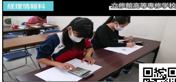
立修館高等専修学校