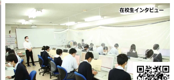
郡山学院高等専修学校