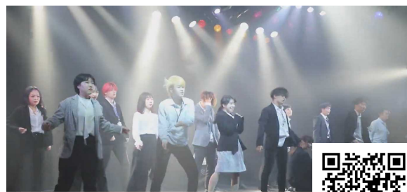
東放学園高等専修学校