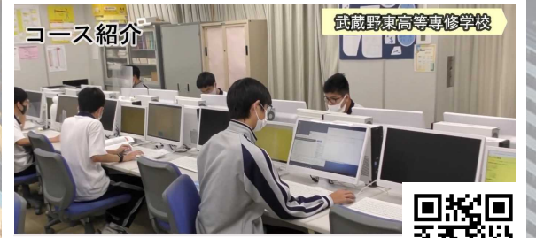
武蔵野東高等専修学校