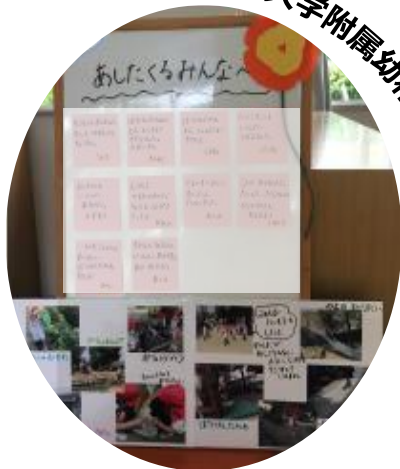
神戸大学附属幼稚園

隔日登園の中、別の登園日の幼児との仲間意識や遊びの共有のため、「あしたくるみんなへ」活動を実施しました。掲示板に、今日の遊びや楽しかったことなどをかきます。翌日、登園した幼児達は、興味深くそれらを見ていました。同じ遊びを始める幼児もいました。