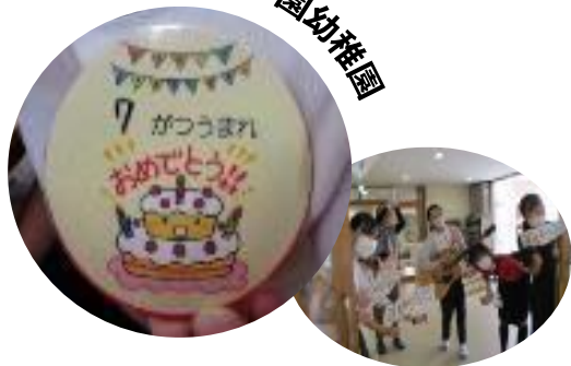
武庫愛の園幼稚園

一斉集合の誕生会は中止し、誕生児はバッジを付けることで、他の幼児がお祝いやすくなりました。また、教職員が給食時にクラスを回ってお祝いパレードを行いました。