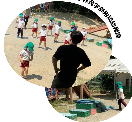
山梨大学教育学部附属幼稚園

休業中に動画配信し家庭で踊っていた踊りで、まずは楽しく体ほぐしをします。外出自粛の影響による体重増加や体の動きのぎこちなさがみられたので、さらに、走る、飛ぶ、投げるなど、発達に応じた多様な動きができるようにしました。