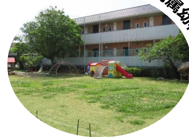
鳥取大学附属幼稚園

園庭で走ったり、三輪車やスクーターに乗って遊んだりすることがより楽しくなるように、芝生やクローバーを刈り、迷路を作りました。