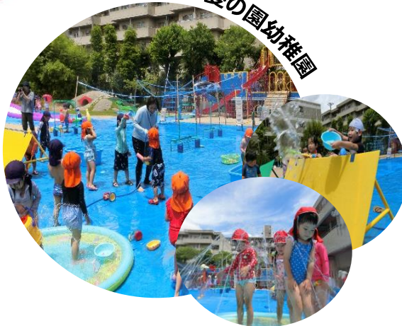
立花愛の園幼稚園

ダイナミックな水遊びの展開のため、グラウンド全体を『ウォーターパーク』へと大改造しました。サバイバル水鉄砲、噴水コーナー、ウォーターライダー、水路作り、水のトンネルコーナーなどを展開し、密を避けつつ、幼児が伸び伸びと遊べるようにしました。