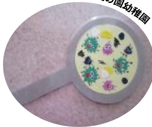
武庫愛の園幼稚園

虫眼鏡のイラストを使って、手洗い前には雑菌やウイルスがいることを見せることで、幼児の手洗いや消毒への意欲を高めました。