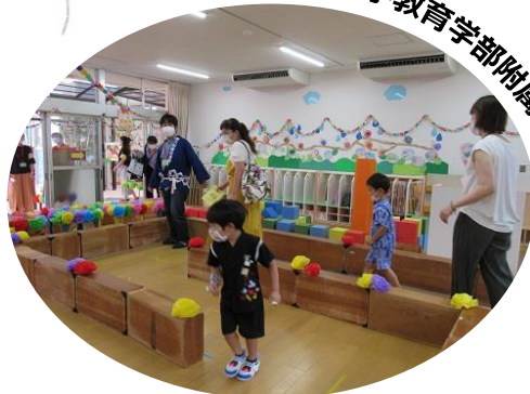
愛媛大学教育学部附属幼稚園

「夜のつどい」を「夏のつどい」に変更し、全体を2グループに分けた分散型にし、年長児発案の店やPTAのコーナー、盆踊りを中心に行いました。花火や飲食は中止しましたが、年長児の店のスペースを広くとったり積み木迷路を一方通行にして密を避けたりして、親子で楽しめるようにしました。