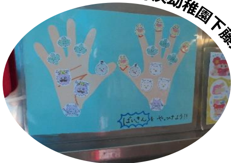
静浜幼稚園下藤分園

手のひらは王様バイキン、指の間はお山バイキン、親指はネジネジバイキン、手首はかけっこバイキンなどを図示し、それぞれこするように、ねじるように、かけっこで手首をつかまえて…など、洗い方が年少児にもわかりやすくなるようにしました。