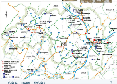
広島県 山県郡 北広島町 7