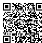
「YouTube」文部科学省 動画チャンネル