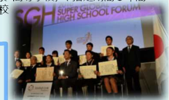
2018年度SGH全国高校生フォーラム (2018年12月15日) @ 東京国際フォーラム