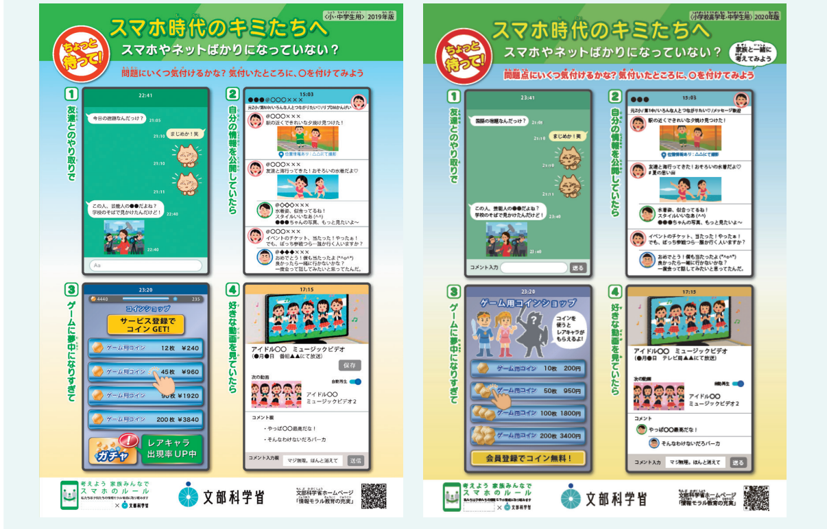
図表 2-11-2 ちょっと待って！スマホ時代のキミたちへ