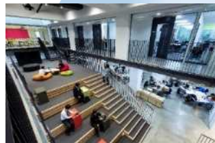
研究室の枠を越えた コラボレーションを生み出す オープンスペース