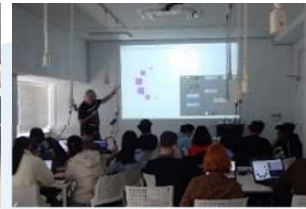
文理融合した 新たな教育