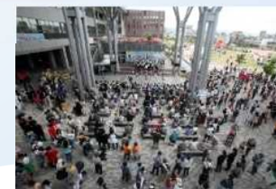
地域に開かれたキャンパス