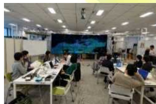
他大学や企業等との オープン・ラボ