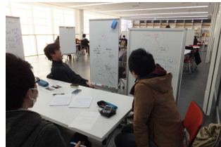
学生同士の アクティブ・ラーニング

⇒ 多様な学生・研究者や異なる研究分野の「共創」、地域・産業界との「共創」の促進等により、教育研究の高度化・多様化・国際化、地方創生や新事業・新産業の創出に貢献