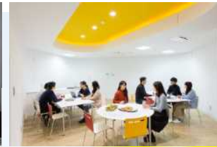
食堂での ランチミーティング