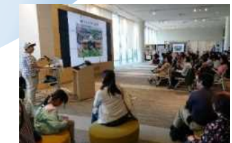
地域への公開講座