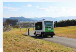
構内道路を活用した実証実験