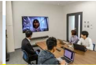
ICTによる コミュニケーション