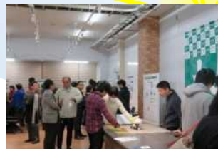
地元企業との交流会