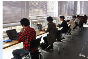
集中して学修 できるスペース