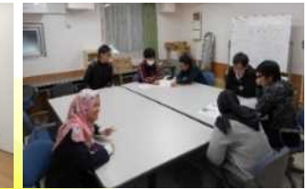
国際寮における 日常的な国際交流