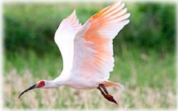
島の空を400羽 のトキが舞う