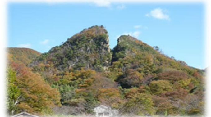
世界遺産をめざす 佐渡金山