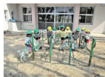
【ハードルの高い一輪車】