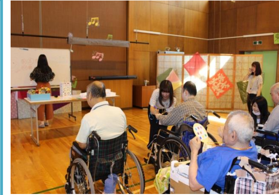
たけのこ学級「ビンゴゲーム」

何を学ぶか(学習内容)：「教養・文化」「実践・技能」「健康」「見聞(学外研修)」「交流(コミュニケーション)」