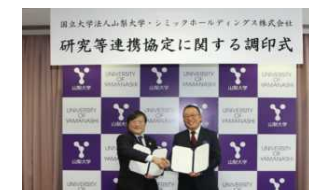
【シミックホールディングス（株）との連携協定】