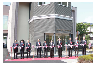
【「大村智記念学術館」完成 記念式典 テープカット】