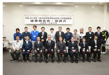
【「燃料電池関連製品開発人材養成講座」成果報告会・閉講式】