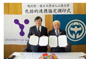
【鳴沢村との連携協定】

・地域自治体と本学の双方の持つ資源の活用や様々な分野での緊密な連携協定を通じて、双方の組織全体としてのつながりを築きつつ永続的なパートナーシップを確立していくため、平成 30 年 4 月に鳴沢村、同年 7 月に昭和町と包括的連携協定をそれぞれ締結した。また、道志村と包括的連携協定の締結に向けた協議を開始した。さらに、同年 11 月にシミックホールディングス（株）と研究等連携協定を締結した。 《30》