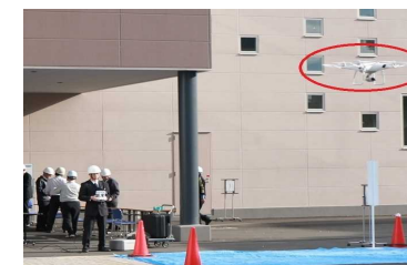
【ドローンによる空撮訓練】