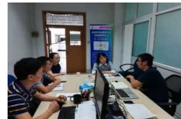
【教員による意見交換】