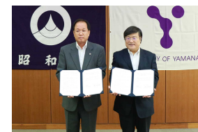
【昭和町との連携協定】