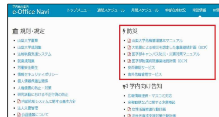
【学内イントラシステム（常設情報）】