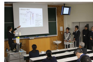
【「医療機器設計開発人材養成講座」修了発表会】