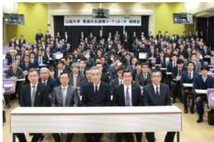
【客員社会連携コーディネータ】

について 99 回の技術相談にも係わり、大学の研究成果（シーズ）と産業界のニーズとの連携に寄与するなど、本学職員と連携しながら地域連携活動を推進した。これら取組を通じ、産官学連携活動を推進した結果、共同研究契約が 221 件、194 百万円となった。共同研究受入額は前年度を下回る結果となったが、契約件数は前年度を上回った。共同研究受入額が減少した理由については、大口契約が終了したことが主な要因に挙げられる。（前年度共同研究契約件数 212 件、218 百万円） 《～30》