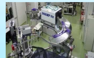
二次イオン質量分析計