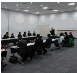
小中一貫校施設整備委員会